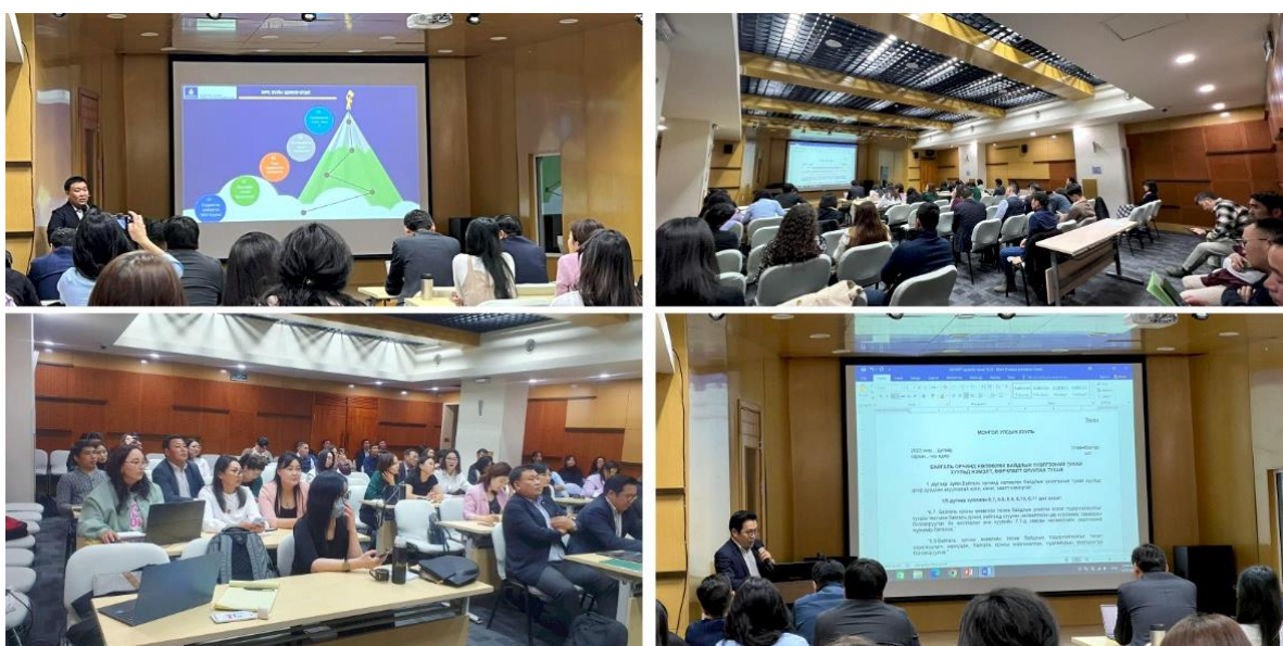
Зураг 1. Байгаль орчинд нөлөөлөх байдлын үнэлгээ эрхлэгч аж ахуй нэгжүүдтэй хийсэн хэлэлцүүлэг

Байгаль орчны үнэлгээ эрхлэгч аж ахуй нэгжүүдтэй 2023 оны 10 дугаар сарын 24-ний өдөр Цэнгэг усны нөөц, байгаль хамгаалах төв УТҮГ дээр нээлттэй хэлэлцүүлгийг зохион байгуулсан. Уг хэлэлцүүлгээр Байгаль орчинд нөлөөлөх байдлын үнэлгээний тухай хуульд оруулах нэмэлт, өөрчлөлтийн төсөл, төслийн үзэл баримтлал, ангиллын судалгаа зэргийг танилцуулан санал авав.