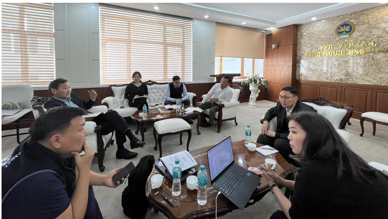
Зураг 2. БОАЖЯ, БОНБУ-ний тухай хуульд нэмэлт, өөрчлөлт оруулах тухай хуулийн төслийн ажлын хэсэг болон Зөвлөх үйлчилгээний багийн хамт Уул уурхай, хүнд үйлдвэрийн яамны холбогдох мэргэжилтнүүдтэй хийсэн зөвлөлдөх уулзалт